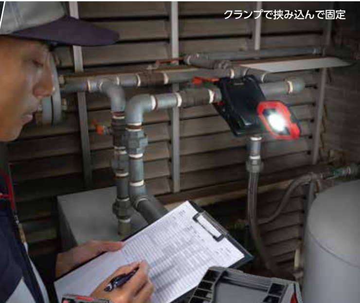
クランプで挟み込んで固定