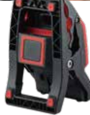
背面(マグネット内蔵)