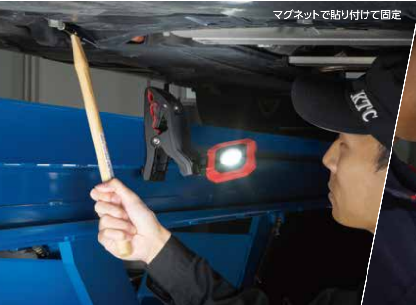
マグネットで貼り付けて固定