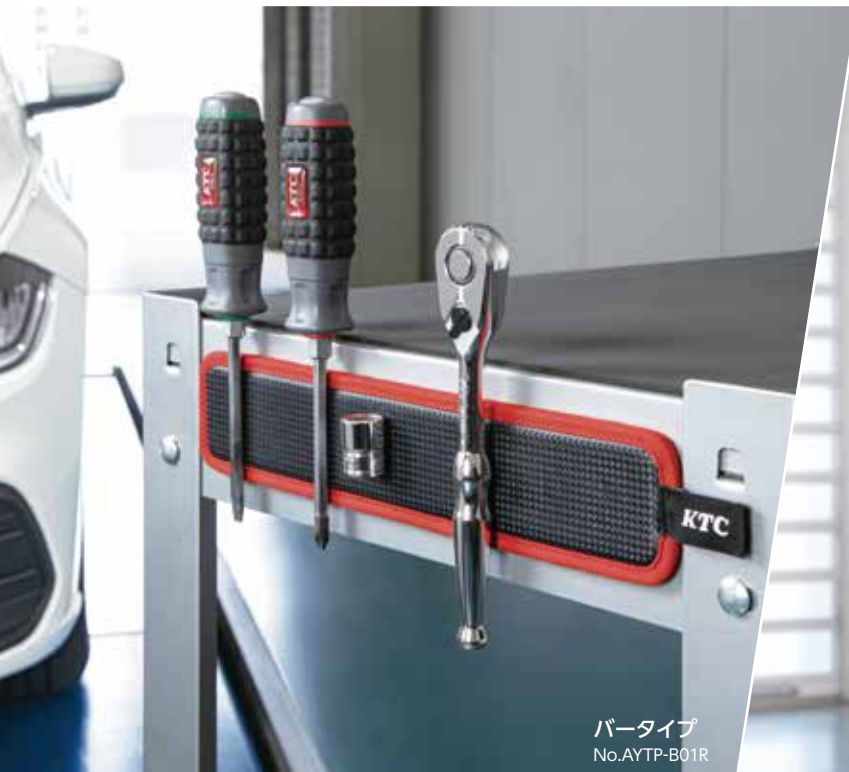
バータイプ No. AYTP-B01R