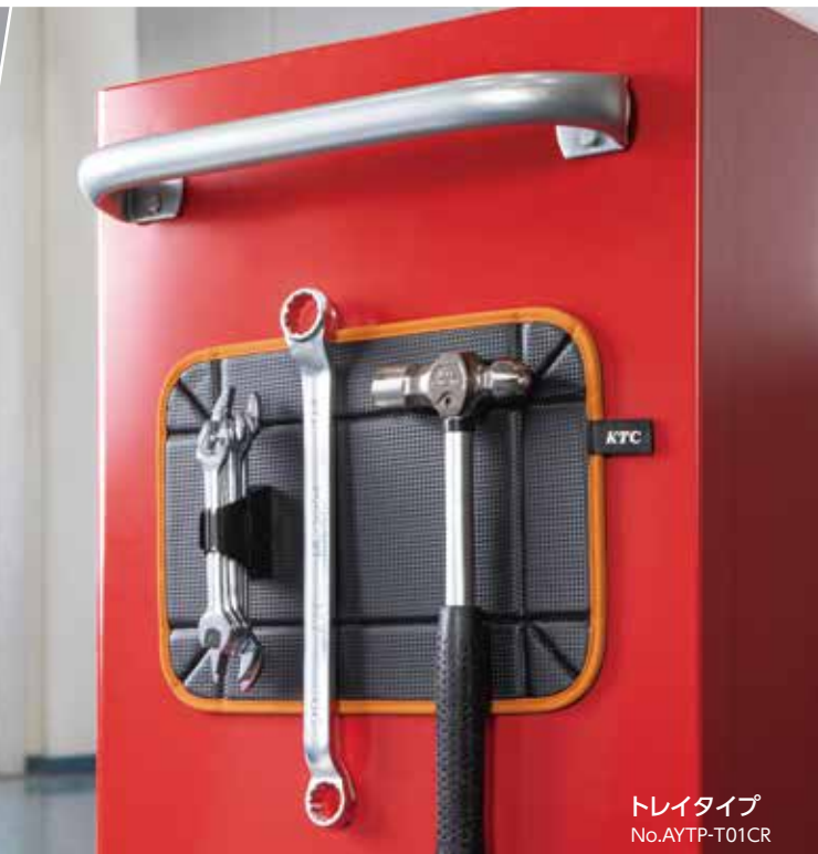
トレイタイプ No. AYTP-T01CR