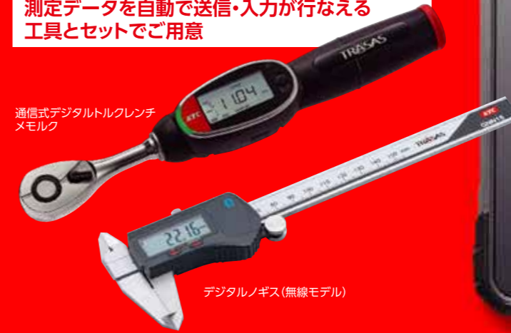
デジタルノギス(無線モデル)