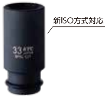
19.0sq.インパクトレンチ用ソケット (ディープ薄肉) ピン・リング付 (33mm) No.BP6L-33TP