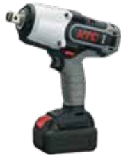
19.0sq.コードレトルクリミット インパクトレンチセット No.JTAE682