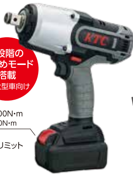
19.0sq.コードレトルクリミット インパクトレンチセット No.JTAE682