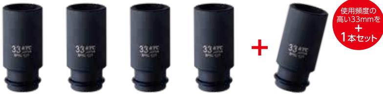
19.0sq.インパクトレンチ用ソケット (ディープ薄肉) ピン・リング付 (33mm) No.BP6L-33TP 5本