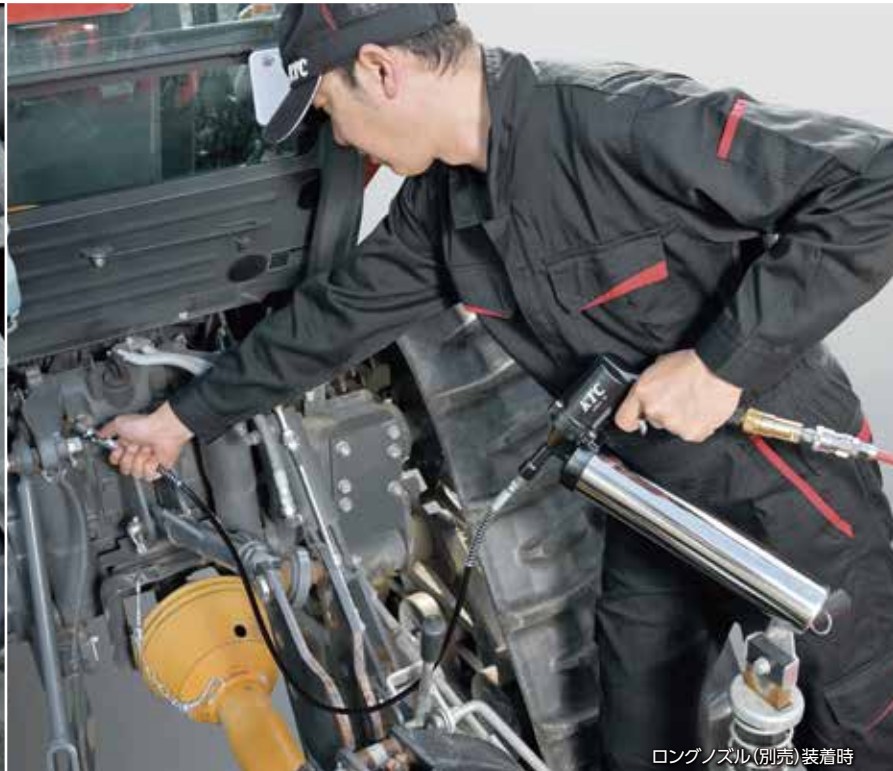
ロングノズル(別売)装着時