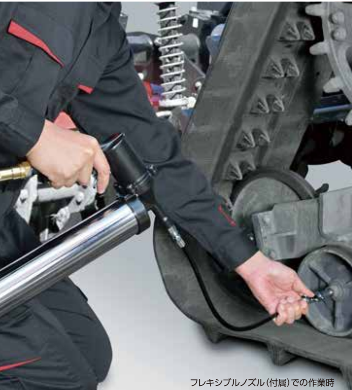
フレキシブルノズル(付属)での作業時