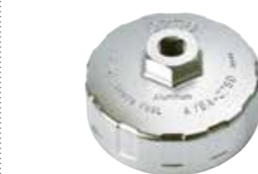
カップ型オイルフィルタレンチ No.AVSA-075D 小売参考価格 ¥3,350