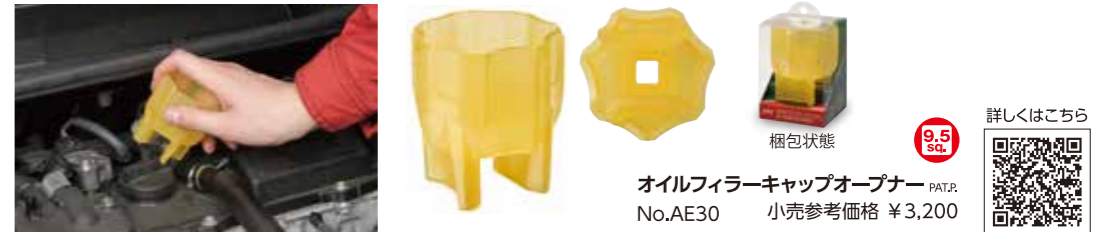
オイルフィルターキャップオープナー PAT.P. No.AE30 小売参考価格 ¥3,200