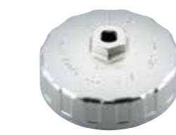
カップ型オイルフィルタレンチ PAT.P. No.AVSA-A92 小売参考価格 ¥3,460