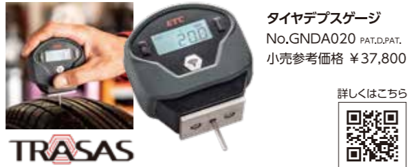
タイヤデプスゲージ No.GNDA020 PAT.D.PAT. 小売参考価格 ¥37,800