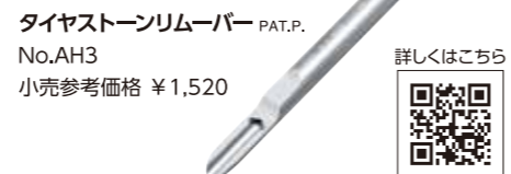
タイヤストーンリムーバー PAT.P. No.AH3 小売参考価格 ¥1,520