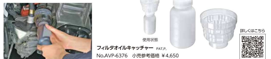
フィルタオイルキャッチャー PAT.P. No.AVP-6376 小売参考価格 ¥4,650