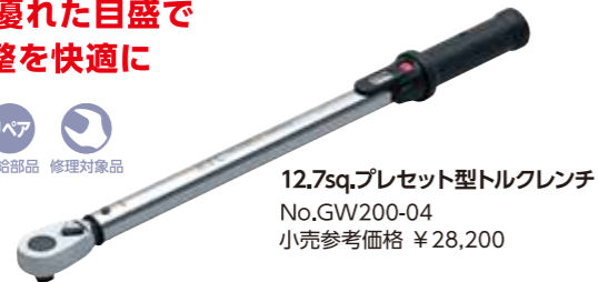
12.7sq.プレセット型トルクレンチ No.GW200-04 小売参考価格 ¥28,200