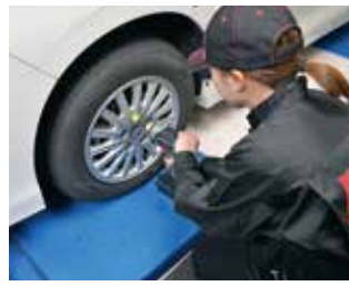
軽量・コンパクトボディで狭い場所でも使いやすい

全長従来比 35% コンパクト ボディ 重量従来比 25% 軽量の 2.1 kg