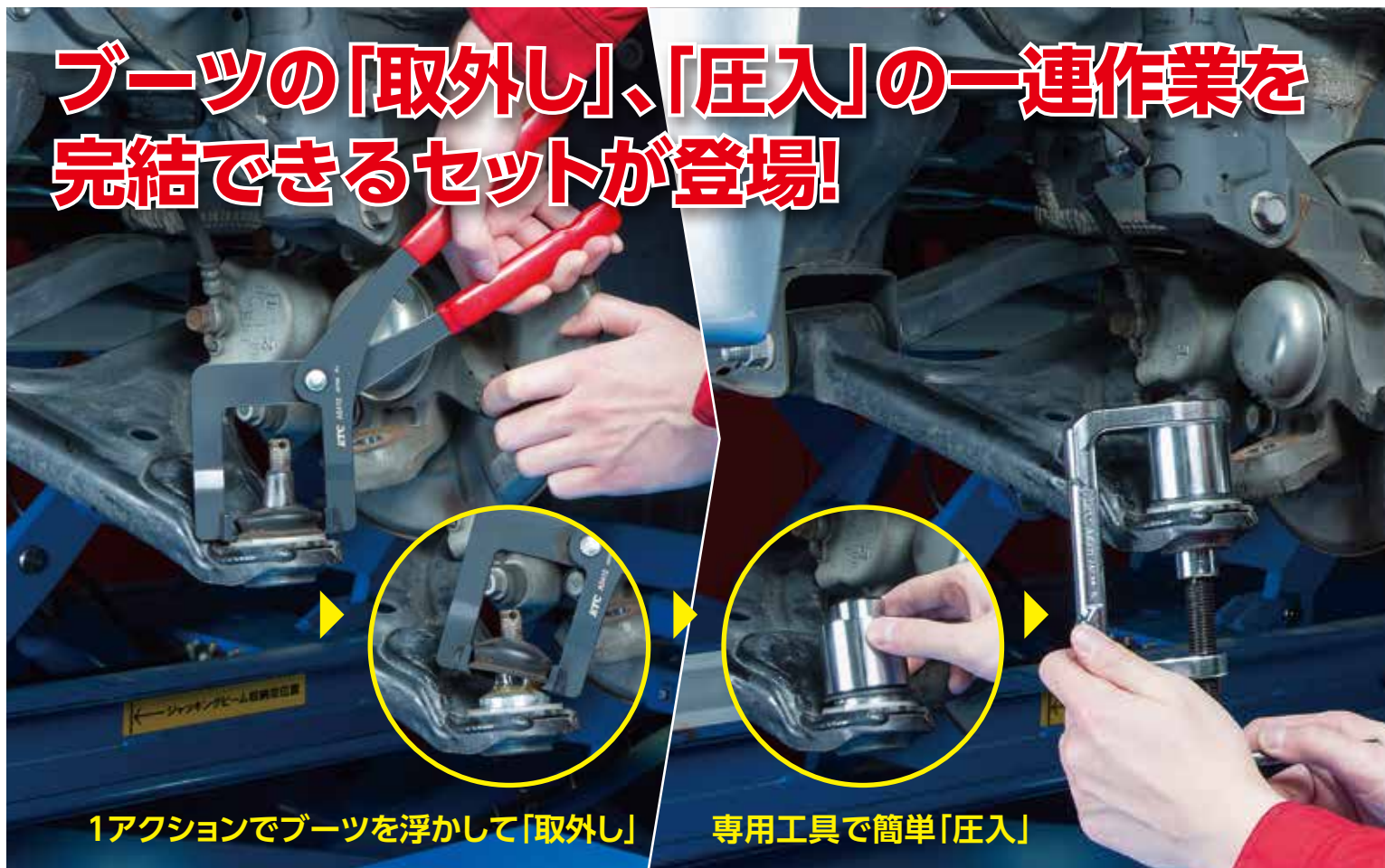
1アクションでブーツを浮かして「取外し」