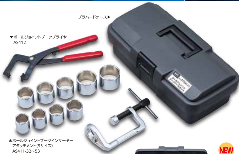
▼ボールジョイントブーツプライヤ AS412