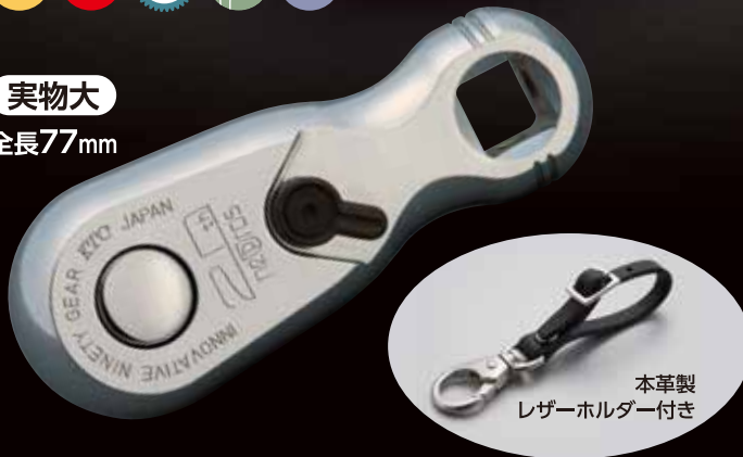
本革製 レザーホルダー付き