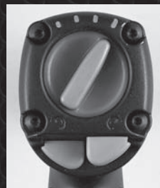
操作性のよいレギュレーターと切替ボタン