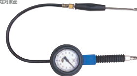
AGT231 (ストレートコネクター)