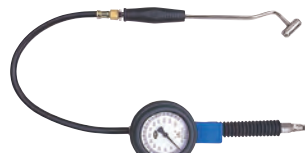
AGT232 (ダブルコネクター)