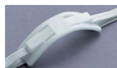
ベルト長さ調整パーツ