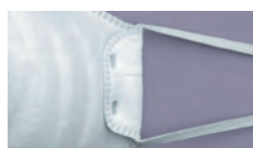
折り返し式ベルト止め& 織ゴムタイプベルト