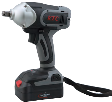
専用樹脂ケース付 (W400 × D326 × H121)