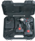
専用樹脂ケース付 (W350 × D285 × H90)