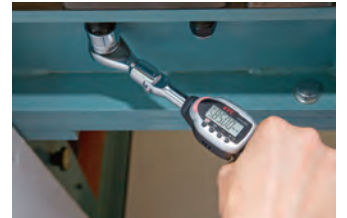
ラチェットヘッドとの組み合わせ例