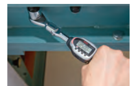
ヘッドを裏返しての使用が可能

-デジラチェヘッド交換式とラチェットヘッドのセットです。 -専用樹脂ケース付き。 (ケースサイズ: W324 × D166 × H58) -専用樹脂ケースには、ソケットホルダー EHB305 (別売) ●P.176 にソケットを付けた状態で収納可能です。 (全長 70mm、外径 32mm を超えるソケット、ビットソケットは収納できません。)