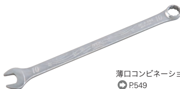
薄口コンビネーションレンチ P549