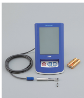
歯科用インプラント手術器具 一般医療機器 販売名:newton-1 医療機器届出番号:26B3X10009130001