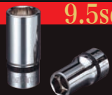
9.5sq. セミディープソケット (六角)