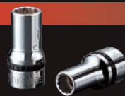
9.5sq. セミディープソケット (十二角)