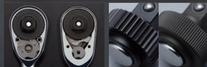
従来品 NBR3UN NBR390 従来品 NBR3UN NBR390

ギアは小判形ヘッドとしては世界最多の90枚。かたつない滑らかな動きと、強度 ※ を実現。90ギア、送り角4°、7段クローの精密な駆動機構をコンパクトなヘッドサイズに凝縮しながら、従来品と同等の強度、サイズを誇ります。 ※nepros NBR3UNとの比較において、同クラスの強度を実現