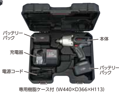
専用樹脂ケース付 (W440×D366×H113)