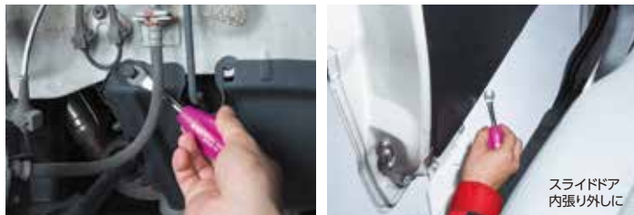
スライドドア 内張り外しに

全長がコンパクトなスタビタイプで、中間軸の傾斜角も寝かせてあるので、狭く奥まっていたり、くぼんだ作業個所でも楽に作業ができます。